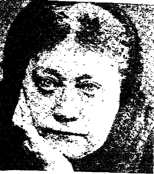
هيلينا بلاتسكي - المبدية